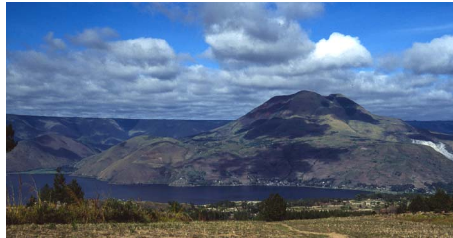
Der Berg - Wohnsitz der Göttin

DIA-Vortrag: ca. 1,5 Std. mit Musik-Mitschnitten; Präsentation von Webereien, anschließend Gespräch