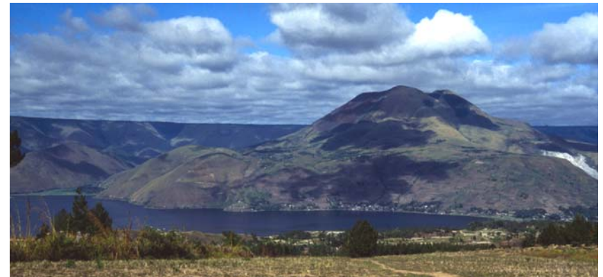
Der Berg - Wohnsitz der Göttin